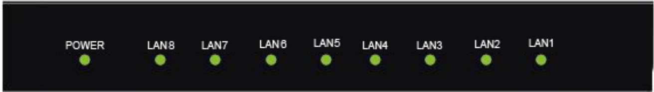
3-1 Ábra: LED jelzések

A hálózati kapcsolón található LED fényjelzők a készülék előlapján találhatóak.